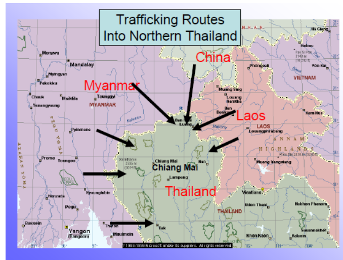
Gambar 1 Demografi Thailand