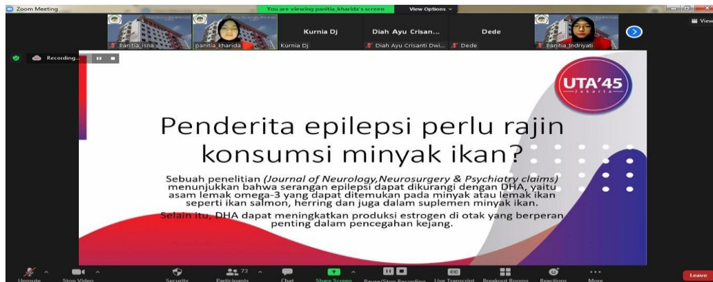
Gambar 2. Pemaparan Materi Webinar Oleh Kharida Zainatus Salamah, S.Farm

Keberhasilan webinar Penanganan Epilepsi Pada Anak merupakan sesuatu yang diinginkan oleh semua pihak baik panitia, narasumber serta masyarakat yang mengikuti jalannya webinar. Keikutsertaan masyarakat dan keaktifan masyarakat selama webinar berlangsung sangat menunjang keberhasilan webinar. Pemaparan materi diberikan oleh narasumber dan pada sesi tanya jawab yang diajukan oleh masyarakat dijawab langsung oleh narasumber berjalan lancar dan kondusif.