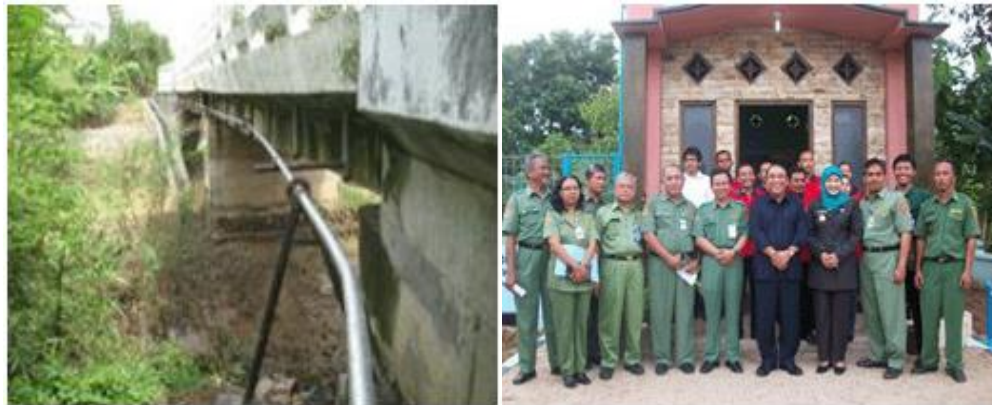
Gambar 3. Pipa Air