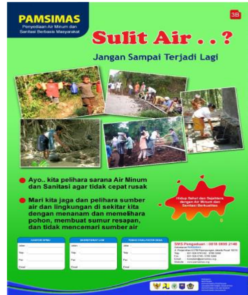
Gambar 4. Contoh poster untuk sosialisasi program PAMSIMAS kepada masyarakat

Sosialisasi dilakukan dengan dengan teknik yang menarik dan persuasif Menarik, sugestif, dan mudah dipahami