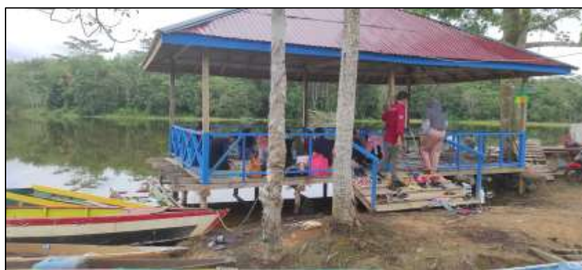
Gambar 1. Lokasi kegiatan berada di area wisata dan pemancingan

Kegiatan ini dilakukan dengan melakukan sosialisasi serta praktek langsung pembuatan kue bolu panggang yang dilakukan secara bersama-sama oleh ibu-ibu peserta dengan tim pengmas ITK (Gambar 2). Pembuatan kue bolu dibagi menjadi 2 tahap yaitu: (a) Bolu panggang dengan menggunakan tepung mocaf ; (b) bolu panggang dengan tepung terigu biasa, adapun perbandingan hasil dan tampilan kue bolu dari dua bahan tersebut secara fisik dapat dilihat pada Gambar 3.