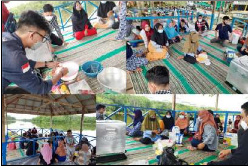
Gambar 2. Praktek pembuatan bolu panggang