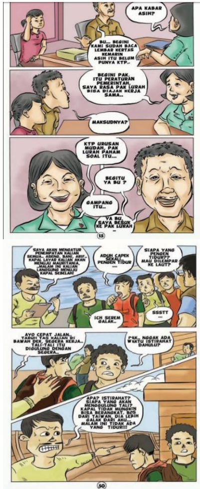
Gambar 2 dan 3. Aspek Kognitif Alur: Ciri-Ciri Perdagangan Manusia