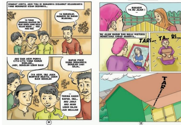
Gambar 4 dan 5. Aspek Afektif Ilustrasi: Perasaan Korban Perdagangan Manusia