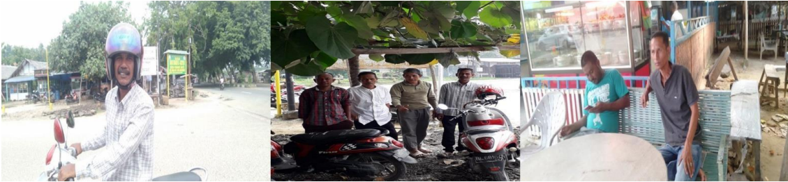
Gambar 5. Penampilan Penarik Ojek Simpang Len (Observasi 7 Agustus 2021)