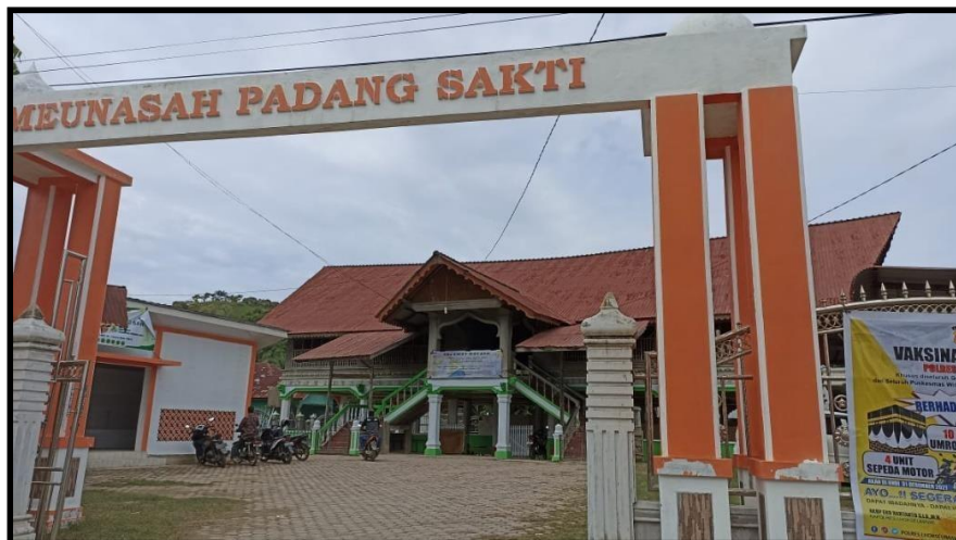
Gambar 6. Lokasi Pelatihan

Tempat/Lokasi : Meunasah Padang Sakti, Kota Lhokseumawe