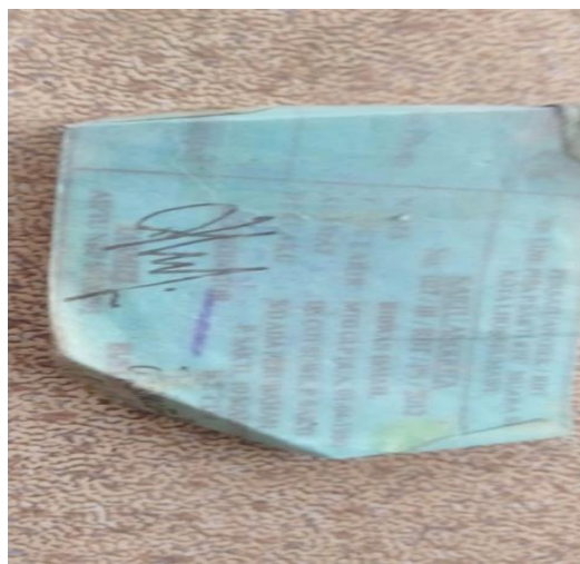
Gambar 2. Kartu Anggota

Sistem giliran ini disepakati berdasarkan no kartu dan kehadiran ke pangkalan RBT, siapa yang lebih dahulu datang maka akan mendapat giliran lebih awal, namun jika pengguna jasa RBT tidak ingin menggunakan jasa seseorang dengan alasan keselamatan, contoh Penarik RBT dengan Usia 70 tahun cenderung tidak melihat polisi tidur sehingga saat melewati polisi tidur tidak tidak pelan-pelan sehingga menimbulkan ketidaknyaman bagi penumpang RBT, sehingga gilirannya dapat diambil alih oleh orang yang berada di urutan di belakangnya. Berikut contoh kartu anggota RBT.