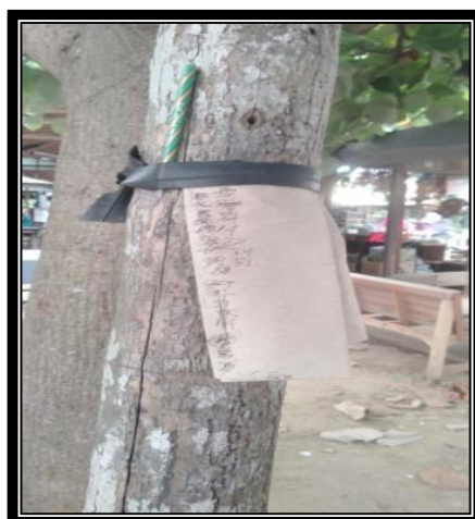
Gambar 1. Pencatatan Antrian Ojek

Sistem Manajemen RBT saat ini belum terkelola dengan baik, diantaranya hal ini terlihat dari spentatan giliran/antrian yang hanya ditulis di atas kertas bungkus nasi yang di tempelkan di batang pohon di samping warung nasi, untuk lebih jelasnya dapat di lihat pada gambar di bawah ini.